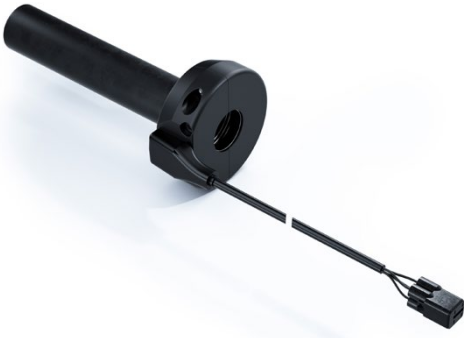
电子节气门基本款